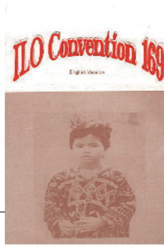
Convenio 169 OIT (1989)